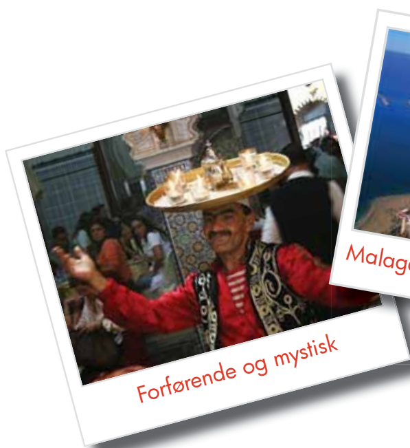
Forførende og mystisk

Alt har sin tid, også vårt opphold under Spanias sol. På vei mot flyplassen rekker vi imidlertid en tur innom Malaga - hovedstaden i på Costa del Sol. En siste tapas lunsj sammen og litt tid til å utforske sentrum blir det før vi drar til flyplassen. Fra flyvinduet ser vi Solkysten forsvinne under oss. Nå bærer det hjem til Norge igjen etter 8 dager med utflukter, god mat og vin og mange hyggelige medreisende.