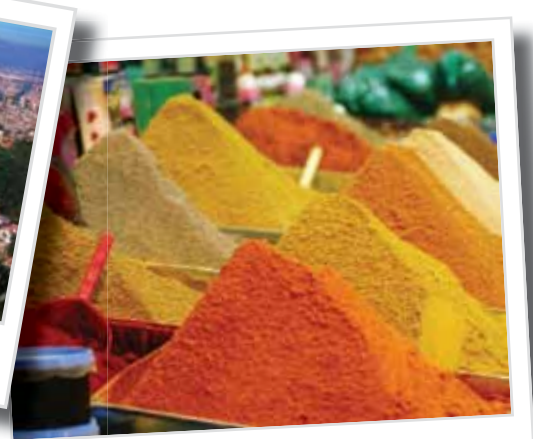
En duft av det eksotiske!