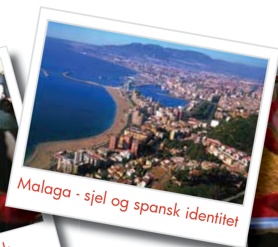
Malaga - sjel og spansk identitet