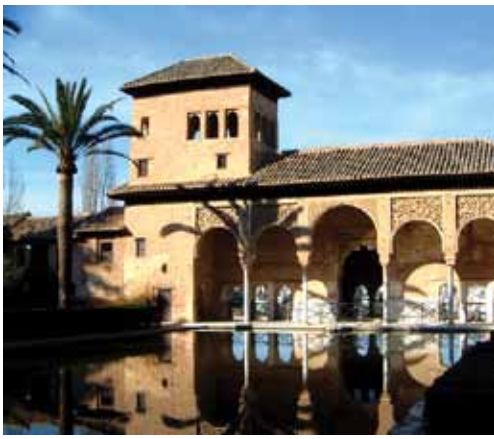
Maurernes fantastiske arkitektur