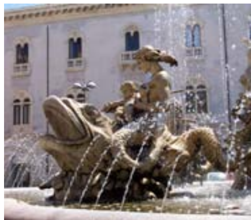
Siracusa, utgravninger og fontener

heldagstur til Catania eller bruke dagen på egenhånd. Catania er en moderne by med mange tradisjoner og imponerende bygninger både i barokk og moderne stil. Bussen tar oss med på en rundtur slik at vi får et lite overblikk over byen før vi tar oss frem til bl.a. Piazza del Duomo, med katedralen og byens berømte elefant. Byens livlige fiskemarked har et spennende vareutvalg som spenner fra fisk til oster og kjøttvarer. Det blir felles lunsj og tid på egenhånd til å se mer av byen. Catania har også gode handlemuligheter for de som heller vil bruke tiden til det.