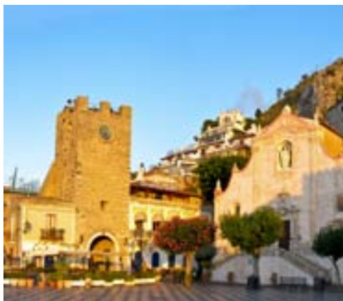
Vakre Taormina i myk kveldssol