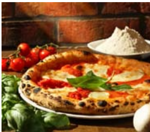
Opprinnelig fra Napoli