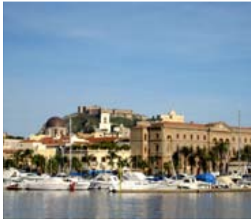
Lipari, sjarmerende og pittoresk