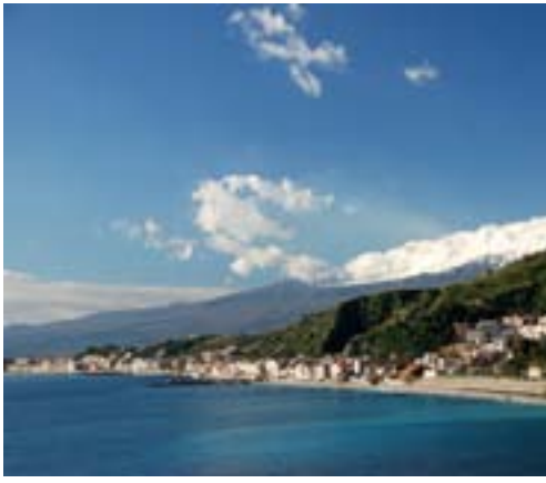
Giardini Naxos ligger vakkert til