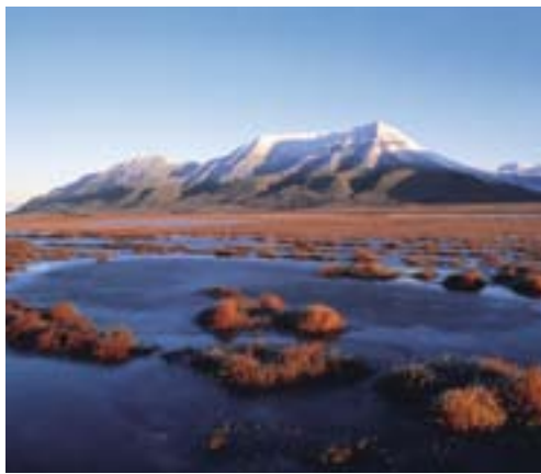
Høst i Longyearbyen