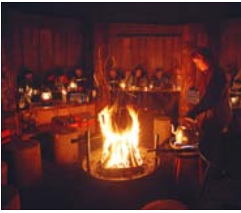
Villmarksaften rundt åpen ild