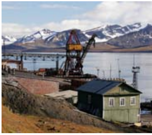
Gruvehistorie langs Burmaveien