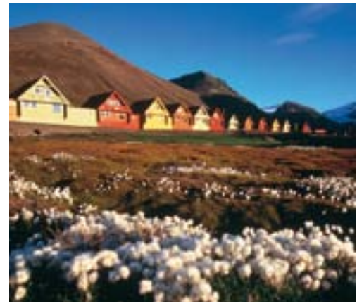
Spisshus – Longyearbyen