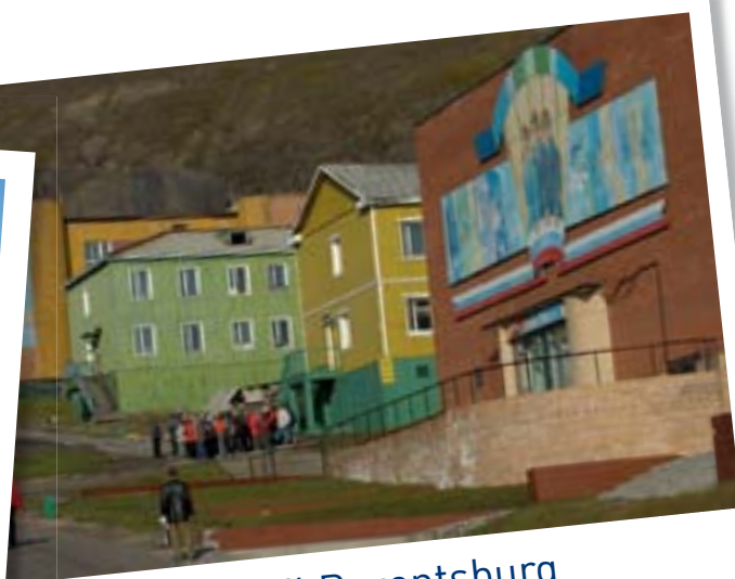
Båttur til Barentsburg