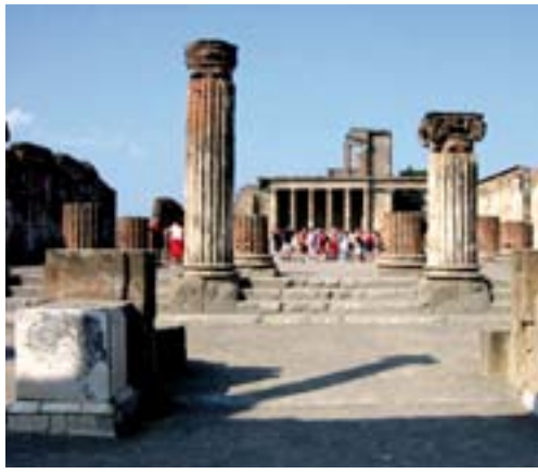
Pompeii - tilbake til år 79