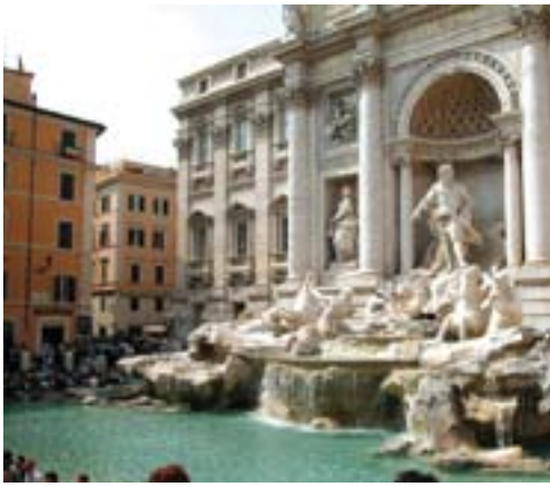
Trevifontenen er et populært treffsted