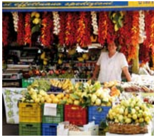
Paprika og sitroner