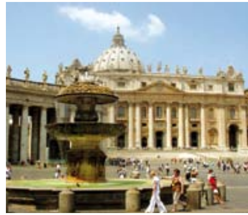
Kanskje får vi se paven?