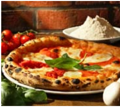
Pizza Margherita - fra Napoli