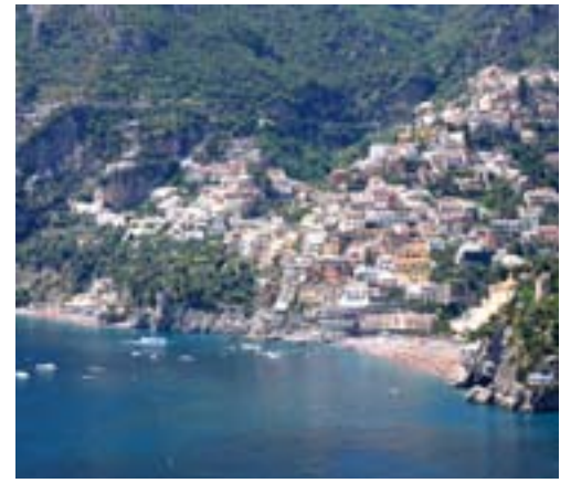
Positano - Italias St. Tropez

og i dag gir stedet et enestående bilde av en romerby med privathus, butikker, offentlige bad og teatre. Vulkanutbruddet kom så plutselig at mennesker og dyr ikke rakk å flykte. Dette frosne øyeblikksbildet av hverdagslivet i en romersk by for mer enn 1900 år siden vil etterlate oss med mange tanker.