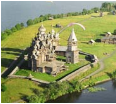
Kizhi med enestående trearkitektur