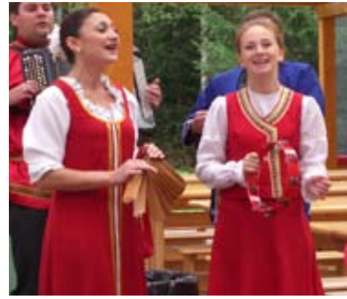
Levende og fargerik folklore