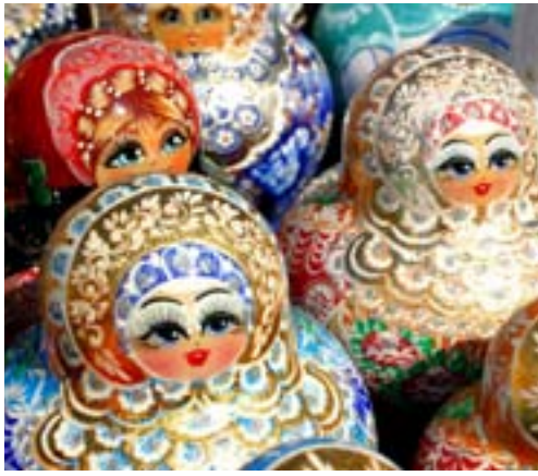
Elsket leketøy og flott brukskunst