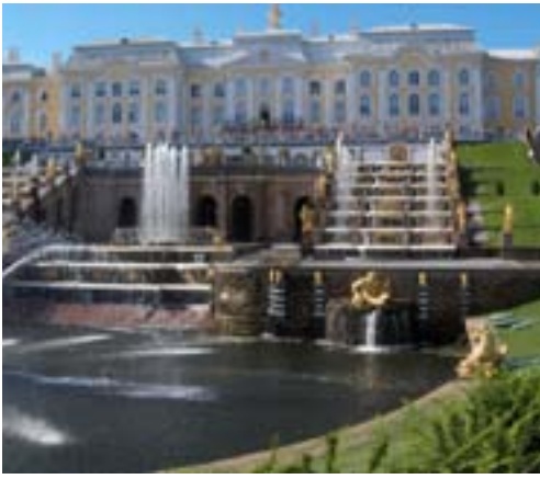
Peterhof - Russlands Versailles